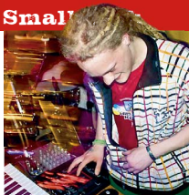
1 | Heizen ein: Die ReggaeKläuse