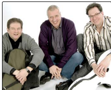
TRIO BAMBERG | Freilichtbühne | Marburg | 18.1.