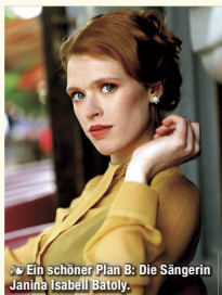
» Ein schöner Plan B: Die Sängerin Janina Isabell Batóly.