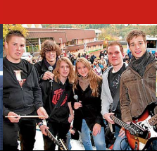
3 | Local Heroes: Clean Distortion

D egen die Kälte. Beim monatlichen Live Szenario'n Dance kann man die Kälte aus den Knochen tanzen. Reggae- und Rocklänge von zwei Bands und einem DJ lassen bestimmt den Winter vergessen. Auf der Bühne stehen diesmal die alternative Rock Band Siamese Smile aus dem schönen Westertal und die ReggaeKläuse aus Kassel. Danach legt DJ Kamil Funk und Soul auf. Diese erlesene Mischung gibt es am Do., 06.01. im Auffa in Marburg. →1