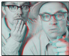
BADESALZ | Freilichtbühne | Marburg | 29.1.