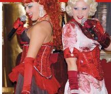
4 | Beim Gangster-Dinner in die 40er.