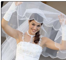
HOCHZEITSMESSE | Stadthalle | Bad Hersfeld | 30.1.