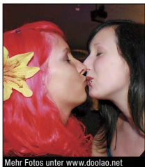
Mehr Fotos unter www.doolao.net

Bei Gewerlichen Kleinanzeigen sind solche, die kommerziellen Zwecken dienen oder in irgendeiner Zusammenhang mit haup- oder nebenberuflichen Tätigkeiten stehen. Dafür berechnen wir 2,50 EUR pro Coupoonzelle. Kontakt-Anzeigen werden nur mit Chiffre-Kennung abgedruckt! Der Coupon und weitere Infos befinden sich am Ende des Magazines Das Wu-Kleinanzeigen-Kombi. Zusammen mit der Nord- (Paderborn/Kassel) & der Süd-Ausgabe (Kassel/Marburg) erscheint jede Verkaufs- & Kontaktanzeige in einer Auflage von über 30.000 Stück!