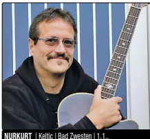
NURKURT | Keltic | Bad Zwosten | 1.1...