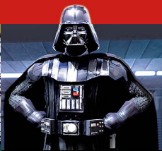
2 | Darth Vader twittert jetzt auch.