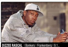
DIZZEE RASCAL | Bonkers | Frankenberg | 9.1...

10.00 DOCUMENTA-HALLE: »Hochzeitsmesse« , die neuesten Trends für Braut, Brautgamt und Hochzeit