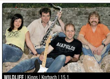
WILDLIFE | Kings | Korbach | 15.1.