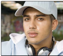
DJ SOLERO | Letrou | Schwalmstadt-Treysa | 28.1.

17.00 DOCK 4: «Das Traumfresserchen» , (Theater), nach einem Text von Michael Ende, (ab 3 J.), 20.00