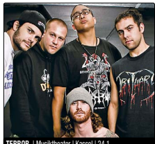
TERROR | Musiktheater | Kassel | 24.1.

19.11 STADTHALLE: Die lachende Eif , (Fernsehauflage)